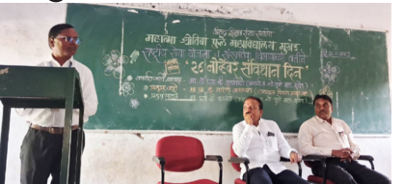
भारतरत्न डॉ. बाबासाहेब आंबेडकर यांनी केलेल्या संविधानाच्या अर्थाने संविधानाचा अर्थ होतो. यावेळी प्राध्यापक, शिक्षकेतर कर्मचारी, विद्यार्थ्यांची भरीव कार्याचा उल्लेख याप्रसंगी करण्यात आला.