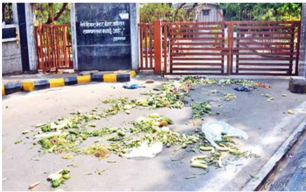
तोपर्यंत अतिक्रमण विभागाने कारवाई थांबवावी, अशी मागणी संघटनेने केली.

दरम्यान सिडको, सातपूर, पंचवटी, नाशिकरोड या ठिकाणी भाजीविक्रेते याला हक्काचा व्यवसाय करण्यासाठी हॉर्सर्स झोन जागा मिळत नाही.