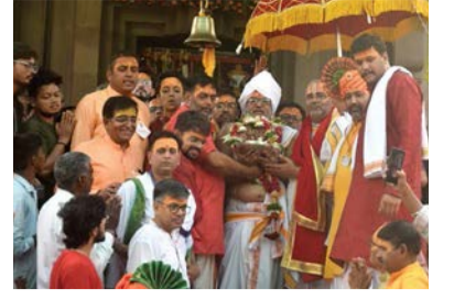
सियावर रामचंद्र की जय चा जयघोष.../८