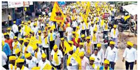
याचदरम्यान, धनगर समाजाकडूनदेखील अनुसूचित जाती प्रवर्गाचे आरक्षण मिळावे, यासाठी ठिकठिकाणी आंदोलन आणि मोर्चे काढत आक्रमक पवित्रा घेतला होता. पण आता सुप्रीम कोर्टाने धनगर समाजाच्या आरक्षणासंबंधीची याचिका फेटाळली आहे.

महाराष्ट्रात गेल्या काही महिन्यांपासून मराठा, आंबीसी समाजात आरक्षणाच्या मुद्द्यावरून संघर्षाची ठिणगी पडली आहे. आंदोलने, मोर्चे, सभा, मेळावे, बैठका यांनी वातावरण ढवळून निघालं होतं. आरोप-प्रत्यारोपांच्या फेरी झाडत सरकारला आव्हानही दिले जात आहे. यामुळे शिंदे सरकारची डोकेदुखी चांगलीच वाढली आहे.