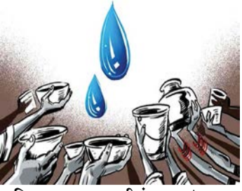
नाशिक शहरावर पाणीसंकट.../८