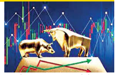
■ शेअर बाजारत पडझड, सेन्सेक्स-निफ्टीची नकारात्मक सुरुवात ▶▶ पान ३