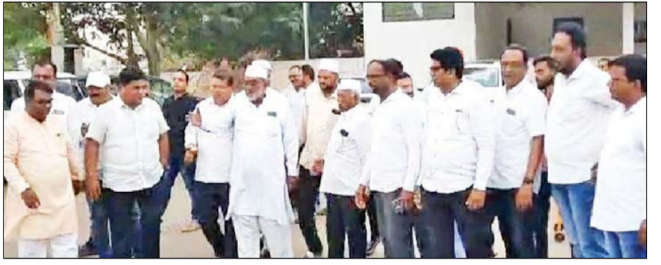
येवला : नाशिक लोकसभा निवडणुकीतून मंत्री छगन भुजबळ यांनी माघार घेतल्याने येवल्यात राष्ट्रवादी काँग्रेस पक्षाच्या पदाधिकारी व कार्यकर्ते यांनी जल्लोष साजरा केला.

मंत्री छगन भुजबळ यांनी येवल्यातून उमेदवारी करावी म्हणून असा कार्यकर्त्यांचा आग्रह आहे. नाशिक लोकसभा निवडणुकीतून मंत्री भुजबळ यांनी माघार घेतल्याने