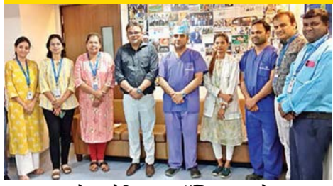
■ अशोका मेडिकल हॉस्पिटलमध्ये जागतिक यकृत दिन साजरा ▶▶ पान ३